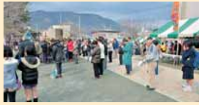
犠牲者の冥福祈るフェスタ会場でも追悼の黙とう 3月11日は東日本大震災の発生から1 年。町でも11日には、防災行政無線を通 じ、町内に午後2時46分からの黙とうの 呼び掛けを行うとともに、本庁舎では半 旗を掲揚しました。 ふくしあつたかフェスタが行われてい た会場でも、フェスタに訪れた人たち、 展示や模擬店に携わる各団体のメンバ ーが、震災が発生した時刻に合わせ町のサ イレンとともに、犠牲となられた人々へ 哀悼の意をささげ黙とうをしました。

「ふくしあつたかフェスタ2012」(町社会福祉協議会主催)が3月11日(日)に、町健康福祉センターと周辺を会場に開かれました。 ステージでは、和太鼓やブラスバンドの演奏、手話コーラス、空手演武などが行われたほか、周辺には焼きそばやおでん、パンなど食べ物の模擬店も数多く出店、人気を集めていました。 センター内では、各団体の活動紹介や作品展示などが行われていましたが、健康志向の高まりを示すように、骨密度測定・体脂肪率測定などには長い行列ができていました。