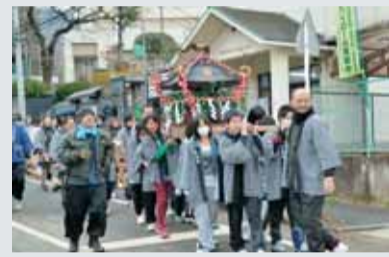
地域に響く寄神社の祭囃子 寄の弥勒寺地区にある寄神社の祭礼が 3月3日、1年の安全と農作物の豊作を 祈願して行われ ました。神輿2 基が地区内を練 り歩いたほか、 町の無形文化財 に指定されてい る「寄祭囃子」 が演奏され、祭 り気分を盛り上 げていました。