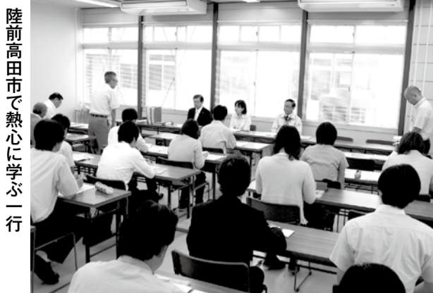
陸前高田市で熱心に学ぶ一行

福祉関係の陸前高田研修リポート 6月22日、私たち役場職員ほか福祉関係者は、岩手県陸前高田市へ東日本大震災後の対応について学ばせていただくため研修に伺いました。