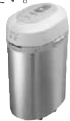
▲電動式生ごみ分解機の1機種(5～6万円)