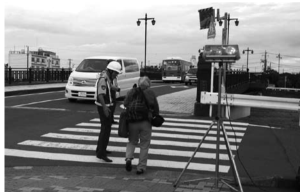
交差点などでの自転車運転に気を付けて(④は高齢者交通安全教室、⑦夏の交通安全運動=いずれも昨年7月)