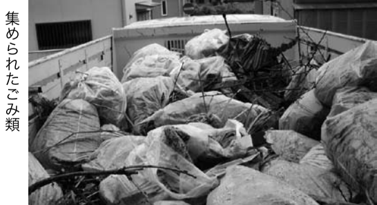
集められたごみ類

川音川親水公園での開始式のあと、午前9時から11時まで両河川の合流点に至る、酒匂川左岸と川音川両岸のさまざまなおみやごみを集める作業に汗を流しました。