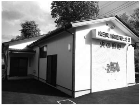
▲新しくなった第七分団詰所