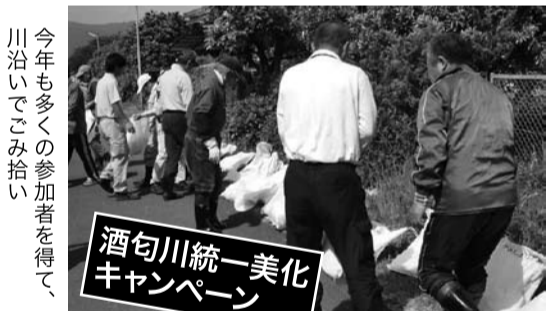
今年も多くの参加者を得て、川沿いでごみ拾い

私たちのふるさとの川を美しく―「酒匂川統一美化キャンペーン事業」の一環として、「水の季節」を迎える5月、恒例となっている河川清掃作業が19日(日)、酒匂川、川音川で行われました。