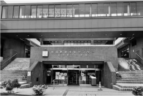
町民文化センター