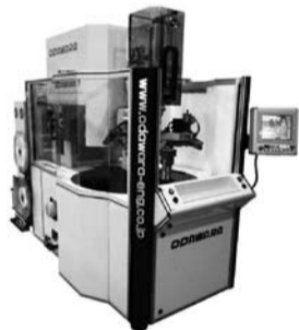
冷蔵庫モーター用巻線機