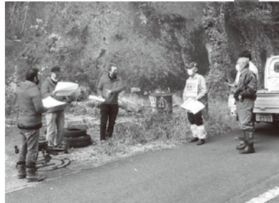
←ドローン技術を活用した農地などの利用状況調査