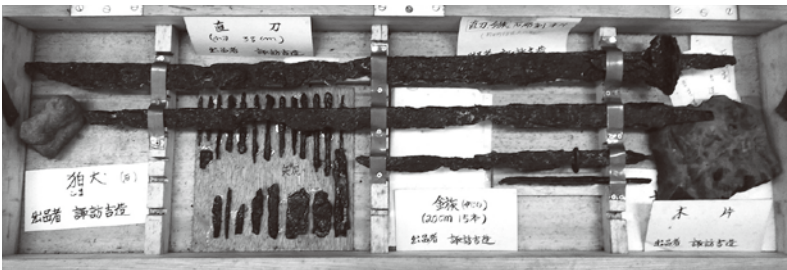
古墳から出土した直刀および鍬