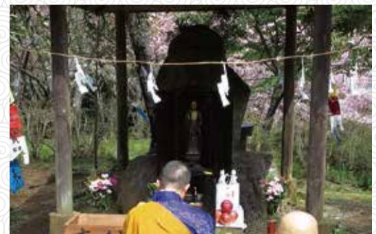
阿弥陀如来立像が中央に安置されています