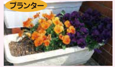
プランター ※大きさは設置場所によって異なります