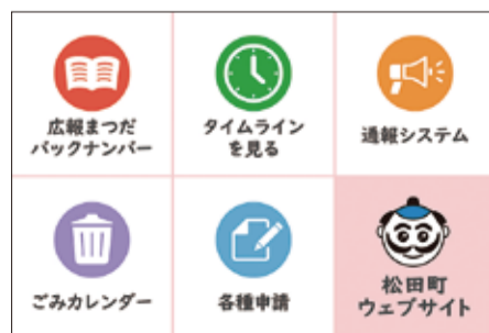
メニュー一覧イメージ