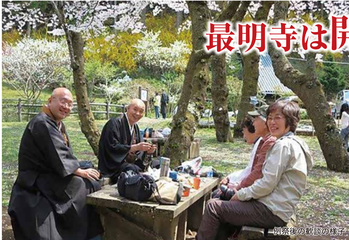
例祭後の歓談の様子