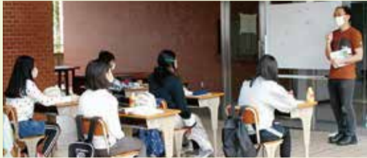
「寺子屋まつだ」での中学生の英語学習