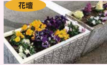
花壇 高さ約40cm、縦約40cm 横約80cm

4月から町内各地に花壇やプランターを増設し、四季折々の花で街中を彩る「花いっぱい運動」を実施します。お花の世話や、花壇やプランターの管理にご協力いただける方を募集します。ご協力いただける方は、問い合わせ先までご連絡ください。