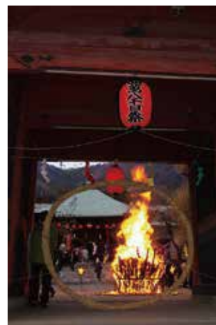
「延命寺お焚き上げ」