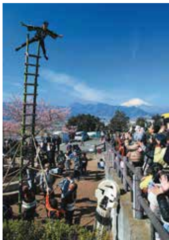
令和元年 写真部門 「天空の決めポーズ」