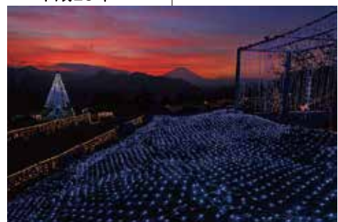
「黄昏のイルミネーション」