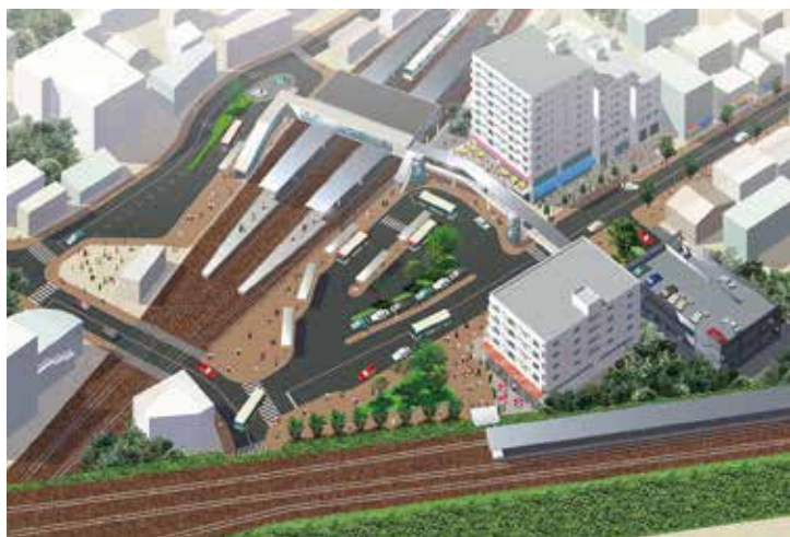
※写真はすべてイメージ図