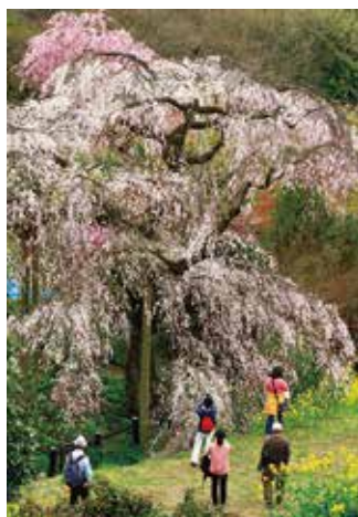
「美しさに魅せられて」