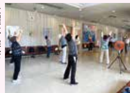
ひまわり健康教室