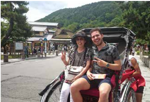
※写真はすべてイメージです