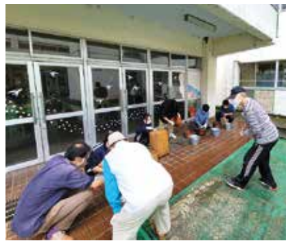
一つ一つ丁寧に掃除していただきました。ありがとうございます。