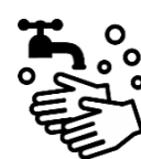
石けんによる 手洗い