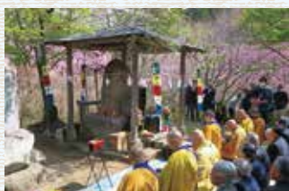
最明寺跡地での施餓鬼会

法要は盛土によって周囲より3m程高くなった護摩堂跡で行われます。そこには「善光寺如来」と刻まれた古い石碑があり、その前に「お善光寺さん」を安置して施餓鬼会は始まるのです。