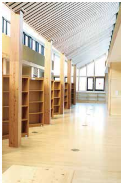
・メディアセンター（図書スペース）

休み時間や放課後の子どもたちの安全・安心な居場所として、地域における読書活動の拠点。