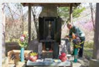
お善光寺さんを祀る(史跡公園)

お善光寺さんは平成9年に町の重要文化財に指定されました。しかし現在、伝統文化を支えてきた庶子自治会の会員数は最盛時の四分の一程になってしまいました。巡行供養を続ける家も減少しているような状態になっています。