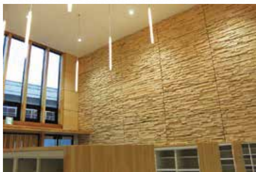
・昇降口の壁にも松田町産の木材が使われています。