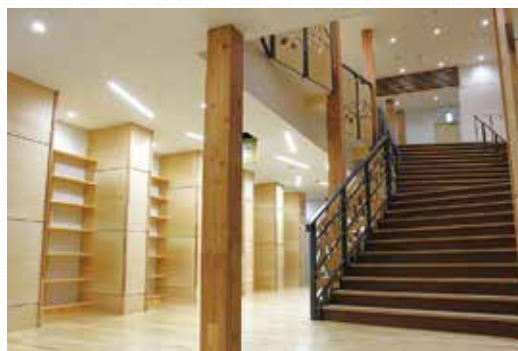
・みんなで学び合う学校の 中心空間

教室の床や昇降口の壁には、松田町産の木材を使用しており、昇降口の壁の乱張りは、松田小学校の児童がグループ学習で作成しました。