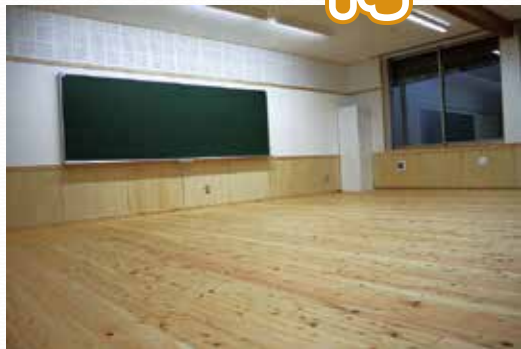
・松田町産の木材を使用した教室の床