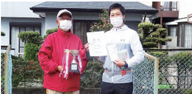
団体優勝 河内自治会 A