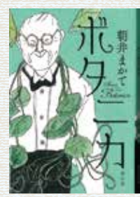
著者 あさい 朝井 まかて