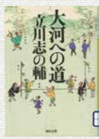
著者 たてかわ 立川 志の輔