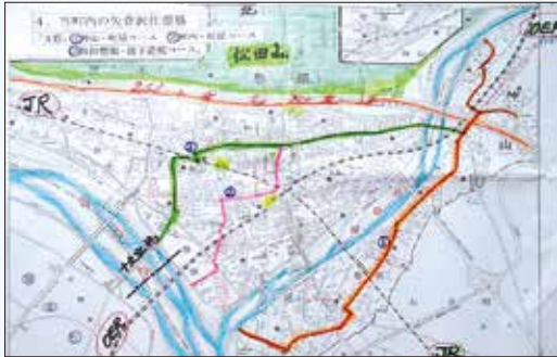
「町内の矢倉沢往還3ルート(当日の映像資料より)」

谷津・薬師堂付近の道のことやJR矢倉沢踏切跡、「幕末・近代の道」では、沢尻の道標と渡し場のことや新松田駅前のロマンス通りについてなど、『道』を中心に広い視野か