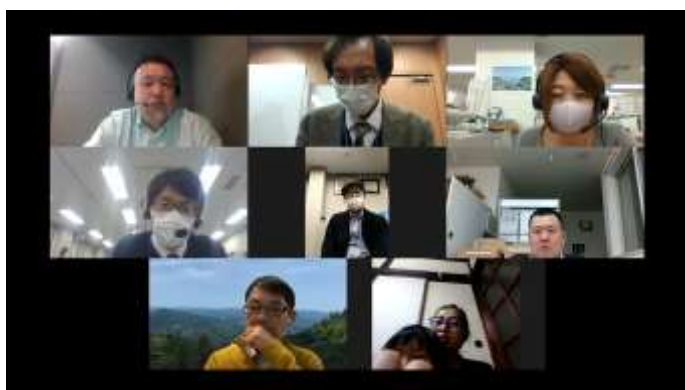
写真2 相談員研修（オンライン）の実施状況