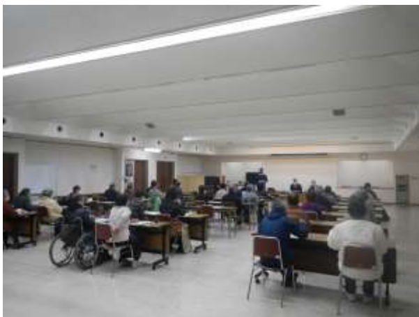
写真3 空き家所有者向け相談会の開催状況