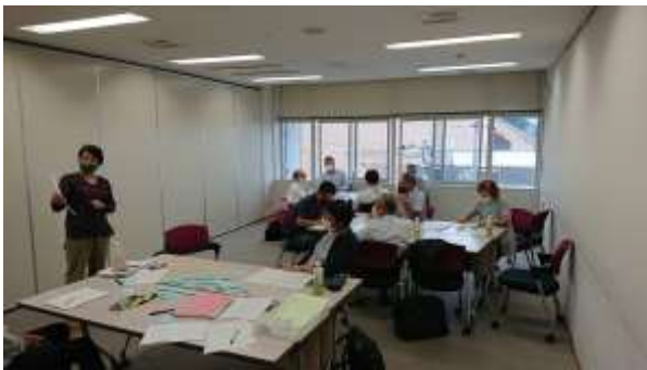
写真1 メンバー会議の実施状況