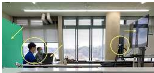
写真4 視察先におけるオンライン移住相談の様子

移住希望者向けの相談業務の実施に向けて、実地での開催を検討していたが、新型コロナウイルス感染症の影響もあり、実施は断念した。他自治体において、オンラインによる移住相談会を開催している例があり、新型コロナウイルス感染症の影響や、移住希望者からしても気軽に参加でき、相談を募りやすいというメリットも考えられることから、相談員と先進事例の視察を行った。