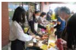
生涯学習センターまつり