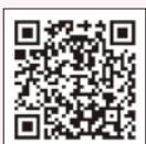
開花状況 (町公式サイト)