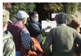
文化財ウォーク(松田城跡)

今年度も、生涯学習センターでは各種講座を開催します。 生涯学習の「はじめの一步」を いっしょに踏み出しましょう。