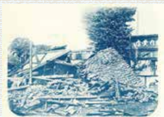
「松田町停車場構内の被害」

き、町内の被災状況を記した文献もほとんどありません。そこで、町民の皆さまからも広く情報を収集したいと思います。例えば、祖父母から聞いた話、知られていない石碑の存在など、町内の関東大震災に関する情報であれば、どのようなことでも構いません。町教育課生涯学習係まで、電話(番号は上記参照)でお寄せください。可能な限り調査させていただきます。一つ一つの歴史のピースを組み合わせ、一緒に「松田の関東大震災」を描いてみませんか。