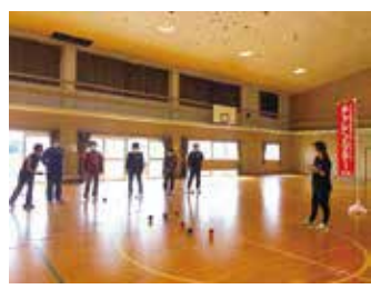
ポッチャ体験会の様子