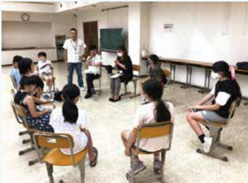
ジュニアキャンプの事前指導の様子

この記事を読んで青少年指導員の活動に興味をもたれた方、松田っ子的のため一緒に活動してみませんか。詳しくはご説明いたしますので、ご自身もしくは紹介できる方がいましたらご連絡ください。青少年指導員一同お待ちしております。