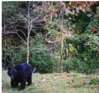
昨年度弥勒寺付近で出没したクマ

③ 山林などへ出かける時 は、鈴やラジオなどの音 が出るものを身に付ける。 万が一、クマと遭遇して しまった場合は、慌てない で背を向けずに後ずさり をし、静かに立ち去りましょ う。