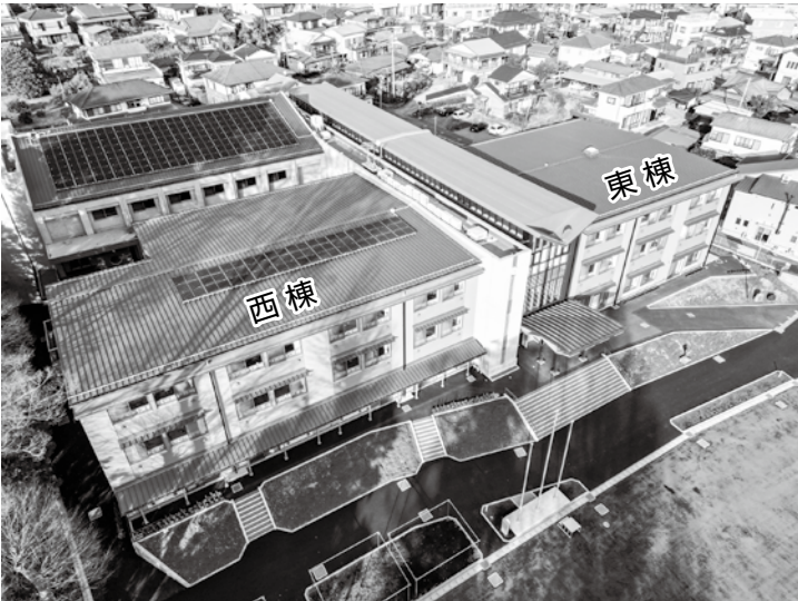
今年度東棟・西棟に太陽光発電設備を設置する松田小学校