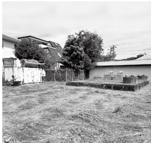
電気設備等の改修工事を行う宮下水源

主な内容は、歳入が、前年度繰越金、新型コロナウイルス感染症対策に活用した感染症対策物品購入に伴う備品購入費を補正するものです。