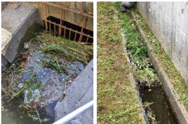
水路にゴミが詰まっている状況

刈り取った草、枝やごみなどを水路に捨てると、水があふれたり悪臭がする原因になります。実際に今年度、水路に草が詰まり、水があふれだし、周辺の宅地などに被害が及びました。 絶対に水路にゴミを捨てない ようご理解協力をお願いします。