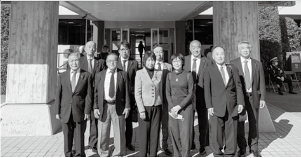
横芝光町役場庁舎前

令和5年11月19日に、本町議会議員が横芝光町を表敬訪問しました。当日は、町長を始め町議会議員の皆様との意見交換や産業まつり、町立図書館の見学等を行いました。