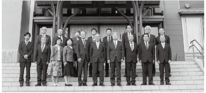
松田小学校昇降口前

令和5年10月19日に、横芝光町議会の常任委員会視察研修として議員14名と町長、議会事務局2名が、本町を訪問され、SDGsの取り組み状況及び松田小学校施設について視察研修をされました。