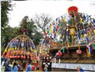
花傘を飾った山車

変わらないよう特訓を重ね臨みます。「祝儀」演奏の際のあいさつ回りでは、お神酒を振る舞うという独特の作法があり伝統になっています。