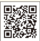
イベント詳細はこちら

もちろん「松田人ファースト」でさまざまなイベントを開催していきますので、ぜひ、遊びに来てください。