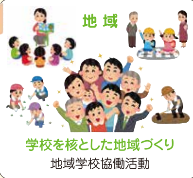
地域 学校を核とした地域づくり 地域学校協働活動