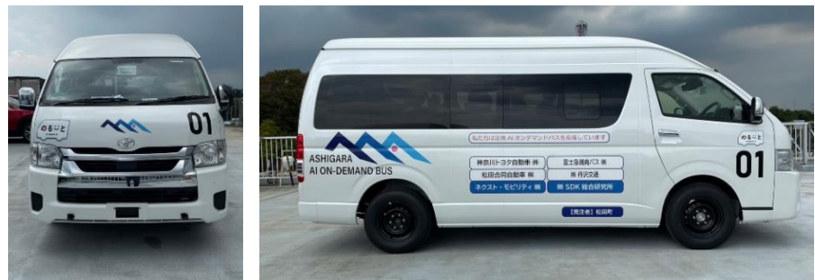
トヨタ ハイエースワゴン 4台