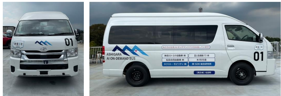
トヨタ ハイエースワゴン 4台