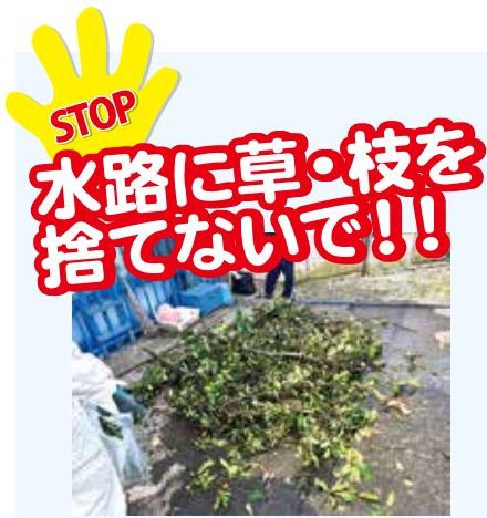
水路に詰まった草や枝

刈り取った草や枝などを水路に捨てると、水路の詰まりや悪臭の原因となります。周辺の住宅や道路に被害が及ぶこともありますので、絶対に水路に草や枝を捨てないようにご理解ご協力をお願いします。