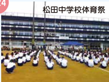
松田中学校体育祭

松田中学校で体育祭、寄小学校で運動会が行われました。全校生徒・児童で作りあげた体育祭、運動会は見ている保護者の方々、地域の方々にとくさんの元気を与えてくれました。