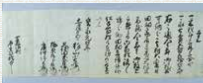
元禄地震への対応を記した史料「覚」(村況1)

おそらく松田町域にあった他の村々でも同じような対応がとられたと考えられます。こうした藩の対応からは、元禄地震で村々がどれほどの被害を受けていたか、容易に想像することができます。