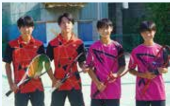
男子ソフトテニス部 (ベスト8)