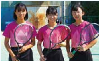
女子ソフトテニス部 (ベスト8)