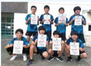
男子卓球部 (団体準優勝)