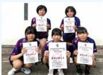
女子卓球部 (団体3位) (撮影日の都合上写っていない生徒がいます)