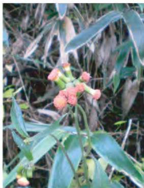
ベニバナボロギク (9月)