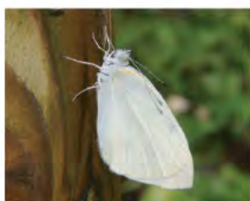
モンシロチョウ (3月～11月)