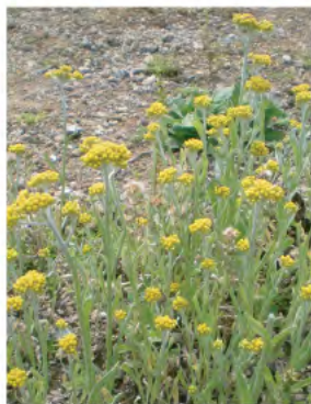
ホウコグサ (ハハコグサ) (4月)