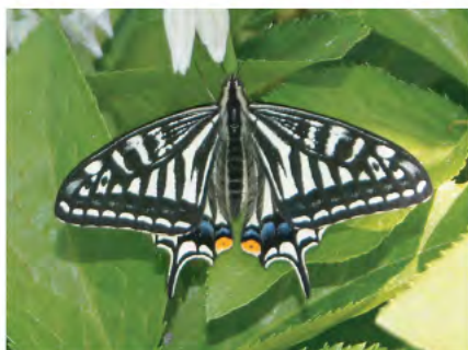
アゲハチョウ (4月～11月)