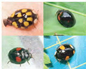
ナミテントウ (4月～10月)