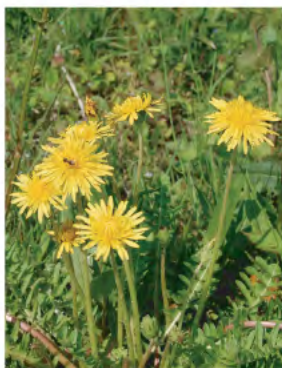
カントウタンポポ (4月)