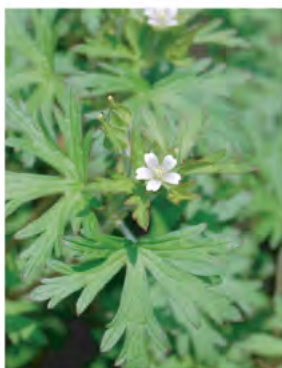
アメリカフウロ (5月)