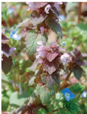
ヒメオドリコソウ (4月)