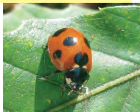
ナナホシテントウ (3月～11月)