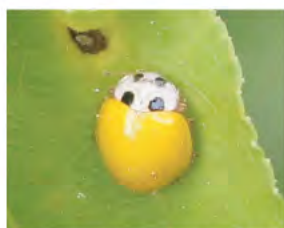
キイロテントウ (4月～10月)