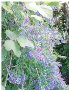
ビロードクサフジ (6月)