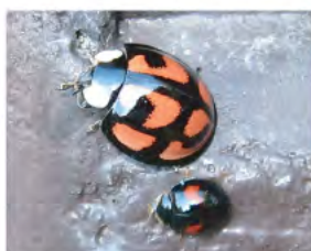
カメノコテントウ とナミテントウ (4月～10月)