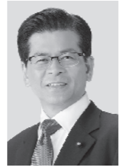
公明党代表 石井啓一

小さな声を聴く力、粘り強い政策実現力、国と地方をつなぐ力— こうした公明党の堅実な力で、未来につながる改革を進めます。