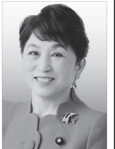
社民党党首 福島みずほ