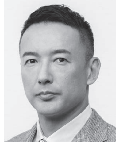
れいわ新選組 代表 山本太郎