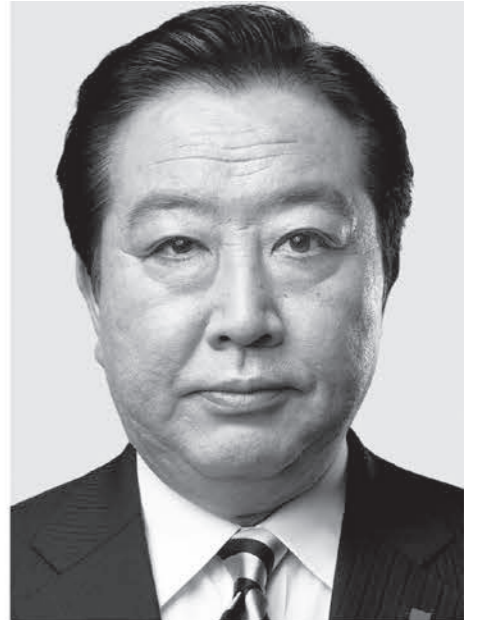
立憲民主党 代表 野田佳彦

1 政治改革 政治の信頼回復 ●政治資金を徹底的に透明化し、裏金・脱税を許しません。 ●金権政治の温床となる企業・団体献金を禁止 ●国会議員の政治資金の世襲を制限 ●税金の使い方を徹底的に透明化、効率化