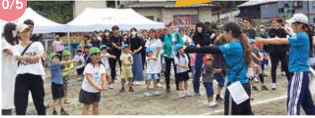
松田・寄幼稚園の合同運動会