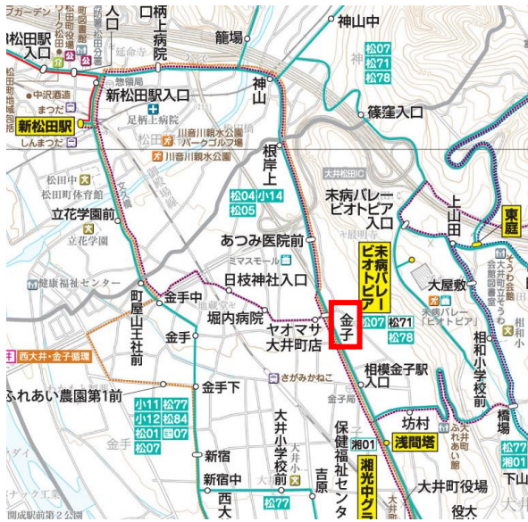
<新松田駅から金子バス停付近>