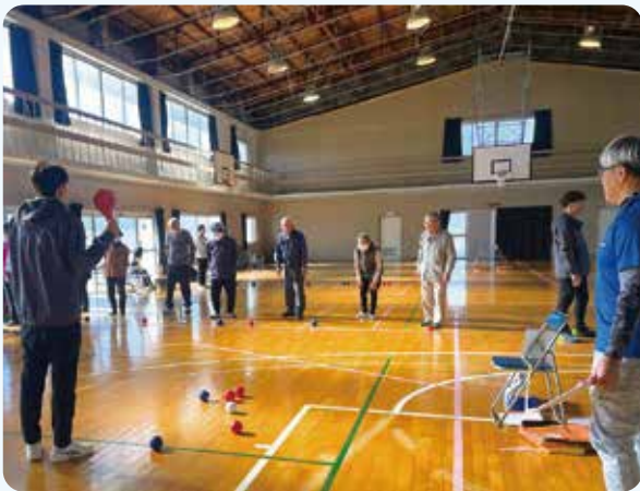
令和6年11月30日(土)の第2回ボッチャ大会の様子