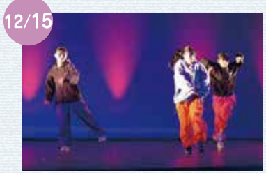
12/15 MATSUDA DANCEフェスティバルを開催しました。子どもから大人まで(13チーム)が出演し、さまざまなダンスを披露しました。