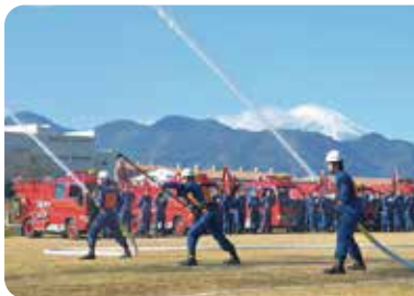
▲今年は第5分団が操法を披露します