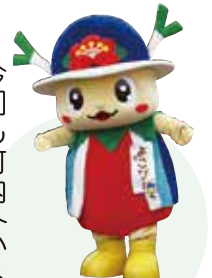
姉妹町・千葉県 横芝光町 よこびー

今回も町内外から多くの方にご来場いただき誠にありがとうございました。横芝光町、千曲市をはじめ、農業や商業のブースなど53団体の出店がありました。旬の農産物や自慢の逸品を買い求める方、飲食ブースで軽食を楽しむ方などでにぎわう秋の1日となりました。