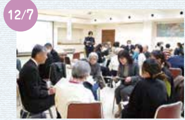
12/7 人権教育研修会(兼)町民大学にて、「インクルーシブ教育から考えるこれからの社会」について、参加者(59人)の皆さんで協議しました。