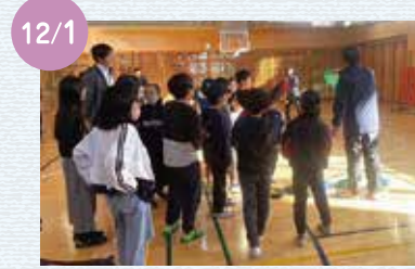
12/1 姉妹町・千葉県横芝光町とのスポーツ交流を行いました。今年は松田町の子どもたちが横芝光町に行き、カレー作りやモルックなどを行い、交流を深めました。