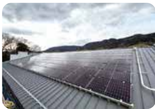
▲松田小学校に設置してある太陽光パネル