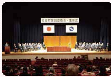
令和5年度の賀詞交換会・表彰式の様子