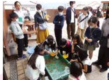
寺子屋まつだの子どもたちによる金魚すくいブース