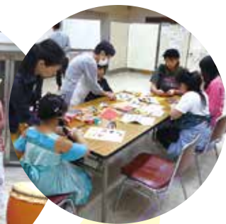
町社会教育委員会議による折り紙でのこま作り