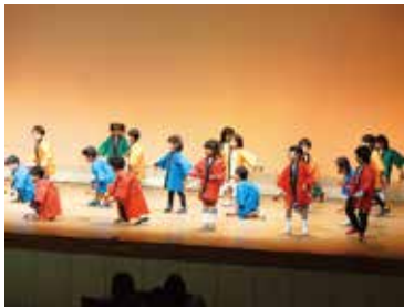
松田・寄幼稚園の園児たちによる「よっちょれソーラン」

舞台発表の参加団体は、昨年よりも多く、寺子屋まつだ幼稚園児のダンス、太極拳、フラダンスに加え、バンド演奏やミュージカル、バイオリンなどの楽器演奏など、さまざまな分野の団体が参加してくれました。1週間前からはリハーサルも始まり、より良い発表をお届けできるようにと各団体で協力して行いました。 展示の参加団体は、準備段階から重いパネルの設置やお客さんが見やすい配置構成を考えたりと協力してブース作りなどを行いました。また、町社会教育委員会議の皆さんのブースでは折り紙体験をしていただき、子どもから大人まで多くの方が楽しんでいました。体験してくれたお子さんは、「難しかったけど教えてもらいながらこまを作りました、楽しかったです!」と仰っていました。