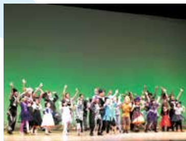
「Kid's Dancing performance、さんたちによるミュージカル発表