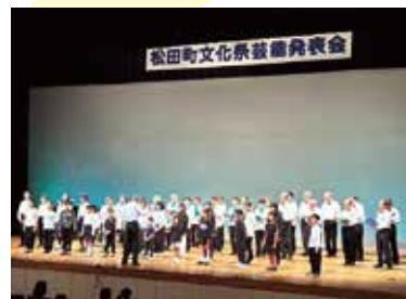
シニアクラブ松田の皆さんと寺子屋まつだの子どもたちによる合同合唱