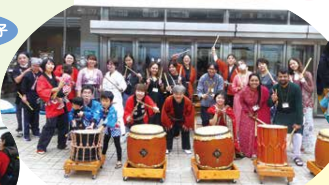
国際交流ボランティアと子どもの館・松田道祖神太鼓研究会の皆さん