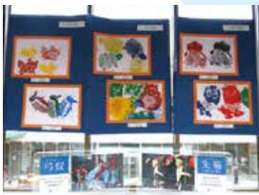
松田町立小・中学校による作品展示