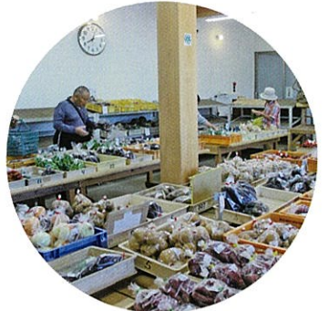
▲四季の里直売所(月曜定休)