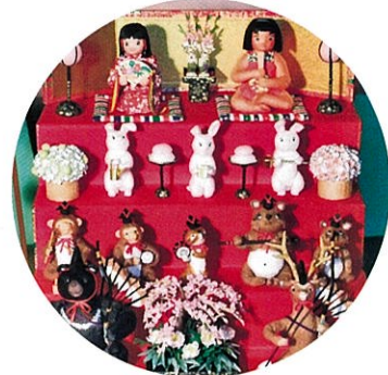
▲和紙雛 金太郎飾り

2/16(日)・2/22(土)・2/23(日)・2/24(月)・3/1(土)・3/2(日) 当日受付