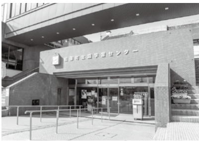
松田町生涯学習センター

【答】 WiFiについては、現状では貸し出しで対応したい。予算が許せば順次様々なサービスの向上を考えたい。