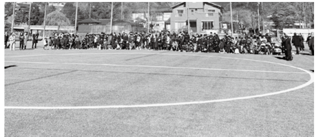
人工芝工事が完成した奇みやま運動広場

産業厚生常任委員会に付託し審査しました。 審査の結果、賛成全員で可決すべきものと決定しました。 なお、持続的な施設運営を図るために、適正な