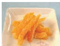
オレンジピール 300円