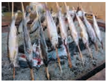
さくら鱈・あゆのいろいろ焼き