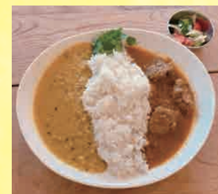
つくばりと豆のあいかけカレー 1,150円

📍松田町寄1330-6 🕒12:00～16:00 🔥水、木、金、土、日 ※土、日はロウバイまつり会場にて出店 🚌バス停「田代向」下車、徒歩約2分 🚌3台 ☎080-5403-2896