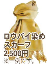
ロウバイ染めスカーフ 2,500円 ※一例です。