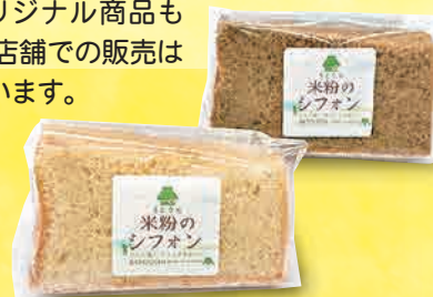
米粉のシフォンケーキ 250～340円(税込)

📍松田町寄1704-3 🕒10:00～16:00 🔥不定休 🚌1台 🚌バス停「札場」下車、徒歩約2分 ☎0465-87-8315