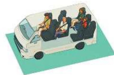
実走車の車内イメージ