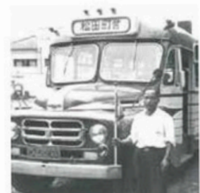
1年間だけ走った町営バス