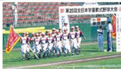
松田キャッスルズ全国大会出場