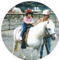
寄ふれあい動物村 (現：寄七つ星 ドックラン)