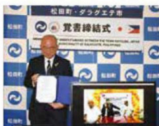
▲ダラグエテ市との「交流の推 進に関する覚書」を締結