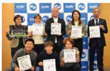
▲元なでしこジャパンの選手による サッカー教室