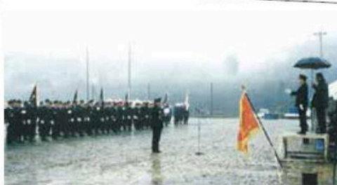
雨の中で行う出初式