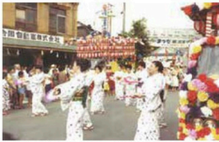
当時の観光まつりの様子