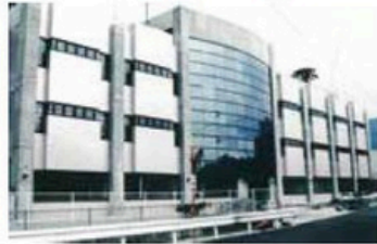
オープン時の町健康福祉センター