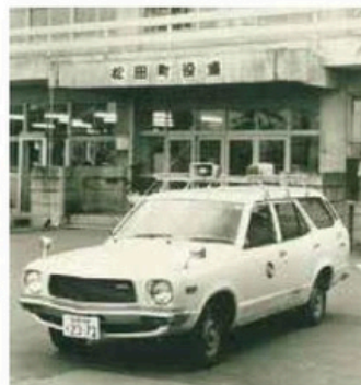
寄贈された広報車