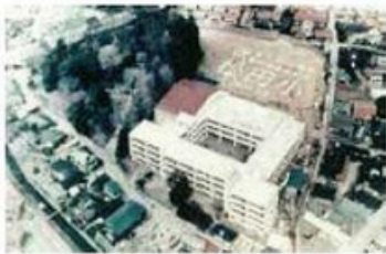
松田小学校開校100周年記念 上空からの様子