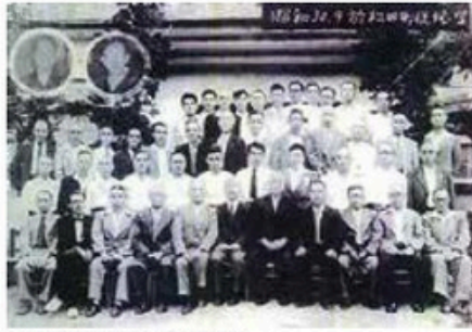
当時の役場幹部職員