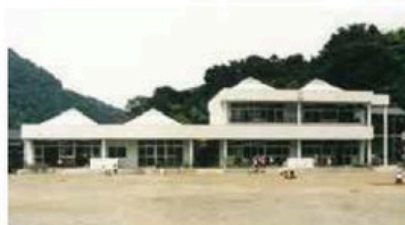
町立第一幼稚園新園舎完成