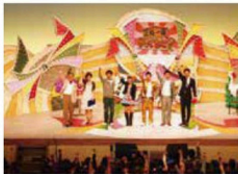
▲NHK「三枝一座」、テレビ東京「出張!なんでも鑑定団 in 松田町」が全国放送