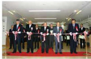
▲町役場新庁舎竣工式の様子