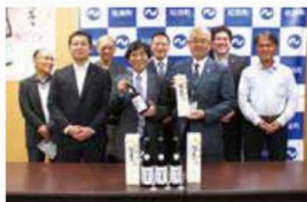
▲町制施行110周年記念 「松田美人」記者発表