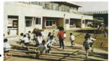
第二幼稚園(現:さくら保育園) が開園