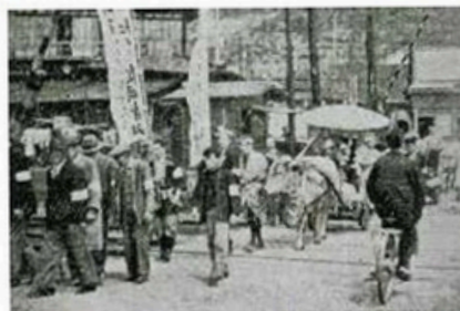
着飾った牛が町を練り歩く様子