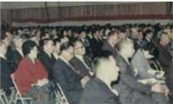
松田小学校記念式典の様子