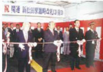
小田急新松田駅南口開通式