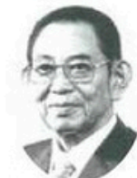
3代目町長熊澤吉次氏