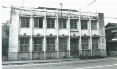
足柄農業会館 (現:綿屋の隣の駐車場)