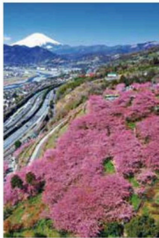
◀西平畑公園からの富士山