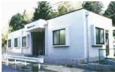
寄総合センター (現：寄出張所・ 寄診療所)完成