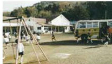
第一幼稚園(現:松田幼稚園) が開園