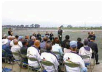
▲酒匂川健康ふれあい広場お披露目式