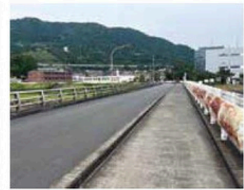
十文字橋(左:歩道設置後、右:現在)