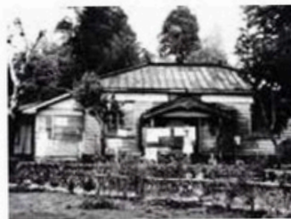
合併直前の寄村役場 (現在の奇診療所・出張所)