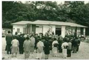
虫沢地区に完成した老人憩いの家