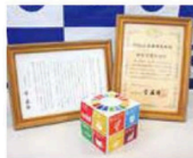
▲SDGs未来都市選定記者発表