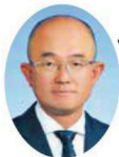
6代目町長 本山博幸氏