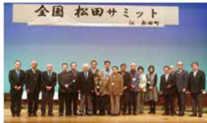
▲全国松田サミットin 松田町開催