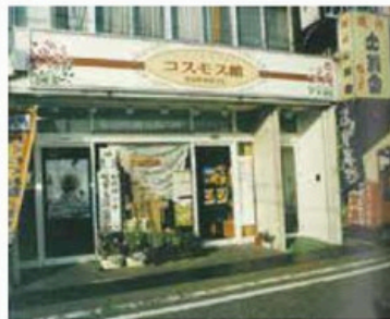
コスモス館オープン