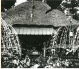
神社の屋根がまだ「かやぶき」