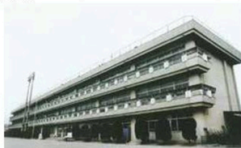
松田中学校新校舎落成