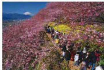
▲第10回まつだ桜まつり