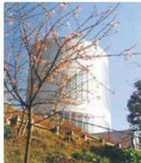
第1回さくらフェスティバル