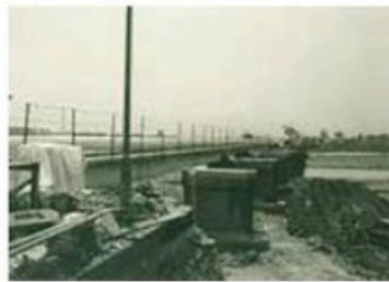
十文字橋改修工事の様子