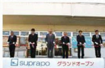
▲suprapo (松田町創生推進拠点 施設) 開業