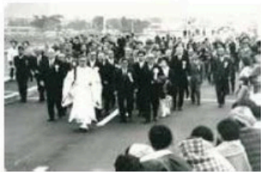
新十文字橋開通式