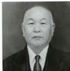
初代町長鍵和田福造氏