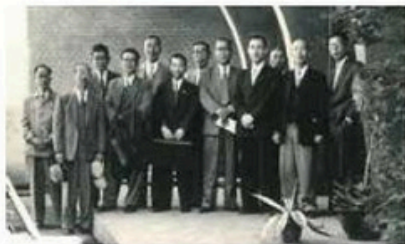
光町姉妹町提携(現:横芝光町)