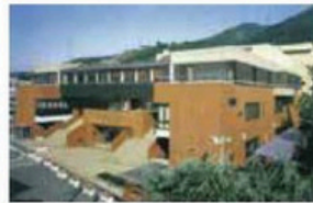
町民文化センターが完成 (現：町生涯学習センター)