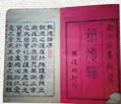
『報徳論』(私蔵) (全99ページの和装本)

この著書を史学者達は「報徳仕法の奥義」「治者の倫理」「政道論(国の治め方)」などと言います。翁は村民がやる気になり働くためには、政治を行う者が「治国の心得・術」を持つことを訴えています。江戸時代「百姓は絞れば絞