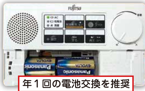
年1回の電池交換を推奨