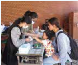
＜青空広場＞ ミニこいのぼりづくり