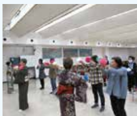
＜展示ホール＞ 日本舞踊体験