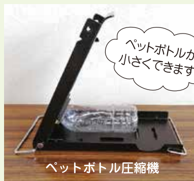
ペットボトル圧縮機