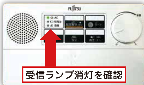
受信ランプ消灯を確認

電波の受信状況が悪いと放送を聞くことができません。本体左上の 受信ランプが消灯 していることを確認してください。受信ランプが点滅(赤色)している場合は、アンテナをしっかり伸ばし、受信ランプが消灯する場所を探してください。正午と夕方の定時放送で受信確認することができます。