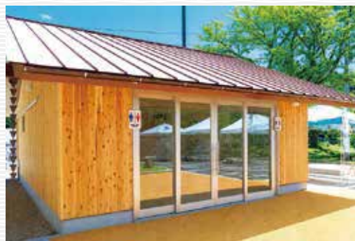
▶ やどりきテラス前