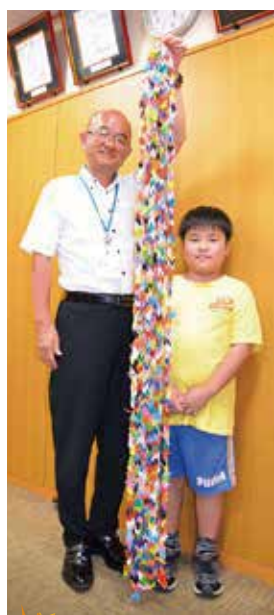
皆さまのご協力を よろしく申し上げます