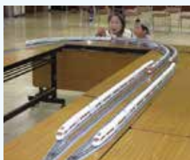
＜展示ホール＞ 鉄道模型の展示