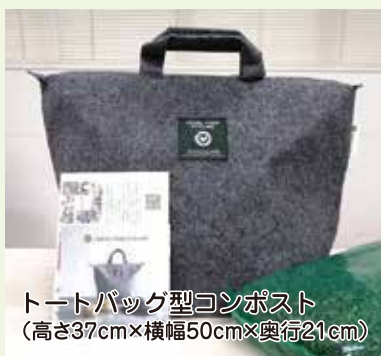
トートバッグ型コンポスト (高さ37cm×横幅50cm×奥行21cm)