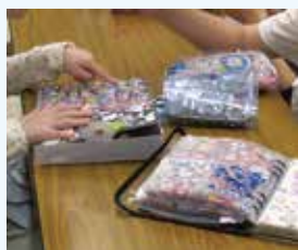
＜展示ホール＞ シール交換会