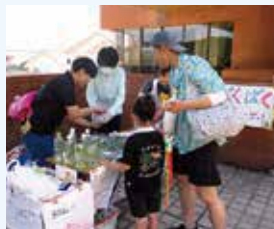
＜青空広場＞ フリーマーケット