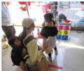
＜寺子屋まつだ＞ わなげ など