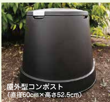
屋外型コンポスト (直径60cm×高さ52.5cm)