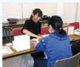
＜第2学習室＞ ハンドエステ体験