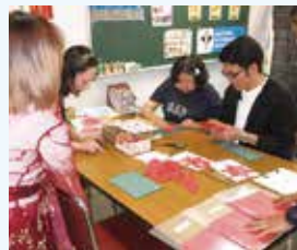
＜国際交流ブース＞ 中国の切り絵体験など