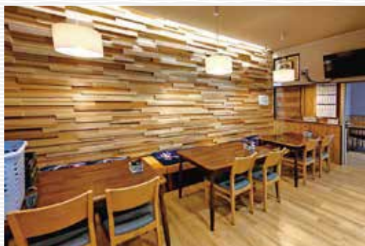
▶ お食事処(みやま浜膳)