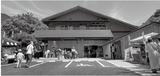
リニューアルした寄自然休養村管理センター

答 新松田駅周辺整備、 スポーツツーリズム拠点 整備による観光振興と雇 用創出、ボトルドウォー