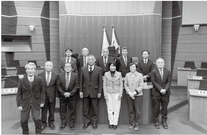
可児市議会議場にて

可児市議会は、議会の見せ方だけではなく、熟議という本質にこだわった議会改革を推進していることで知られている。人口規模は松田の10倍弱で議員定数も22名、市と町とでは単純に真似をすることはできないが、議会の本質、つまり住民の