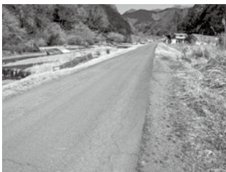
中津川の堤防道路

質 県道710号の代替路線として期待できる中津川堤防道路を、町道認定し整備するお考えは。