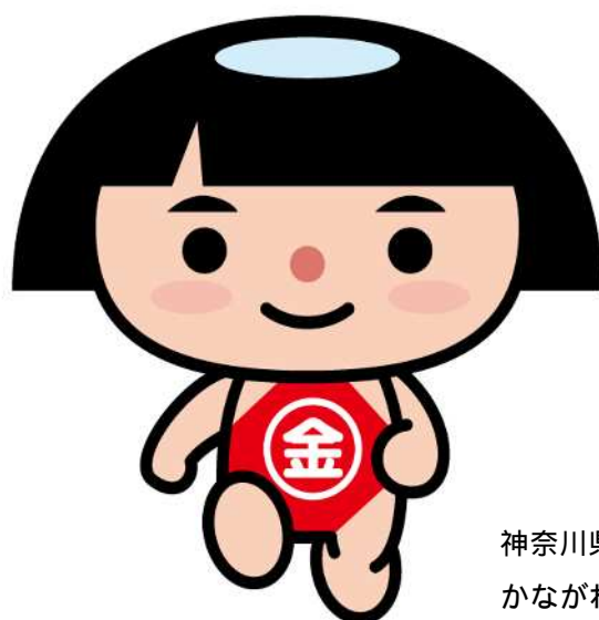
神奈川県PRキャラクター かながわキンタロウ

神奈川県と県内すべての市町村は、平成28年度から個人住民税の特別徴収を推進する取組みを進めています。