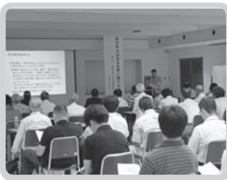
文化センターでの講演会の様子。質疑応答は終了時間いっぱいまで行われました。