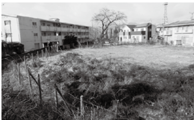
籠場地区の建設計画地

質 PFI事業者が倒産したときの対応は。 答 倒産した場合は、融資元の銀行が業務継続責任を負うことになる。代表企業が倒産した場合は、代表企業を変更して業務を継続することを契約で定める。 質 金利変動時のリスクは。 答 民間事業者が資金調達することから、基本的には事業者のリスク分担となるが、大きな金利変動時には協議をする。