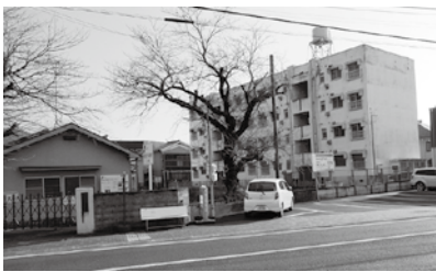
町屋地区の建設計画地

質 PFI事業者が倒産したときの対応は。 答 倒産した場合は、融資元の銀行が業務継続責任を負うことになる。代表企業が倒産した場合は、代表企業を変更して業務を継続することを契約で定める。 質 金利変動時のリスクは。 答 民間事業者が資金調達することから、基本的には事業者のリスク分担となるが、大きな金利変動時には協議をする。