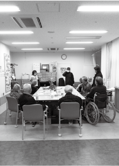
寄のレストフルヴィレッジ