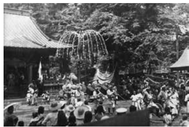
▲戦前(昭和10年頃)の大名行列